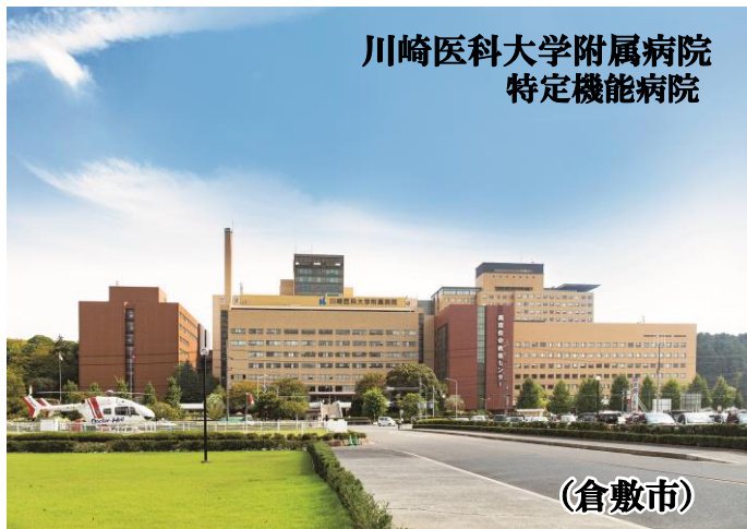
川崎医科大学附属病院 特定機能病院