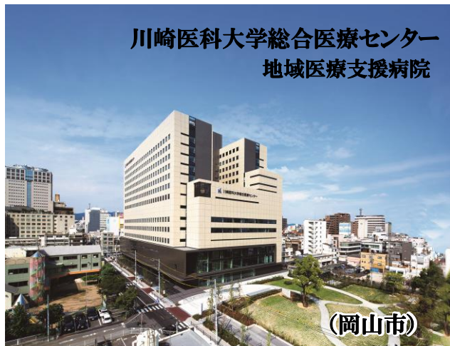
川崎医科大学総合医療センター 地域医療支援病院