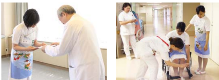
時間/9:30～15:00 場所/西館16階・体験病棟