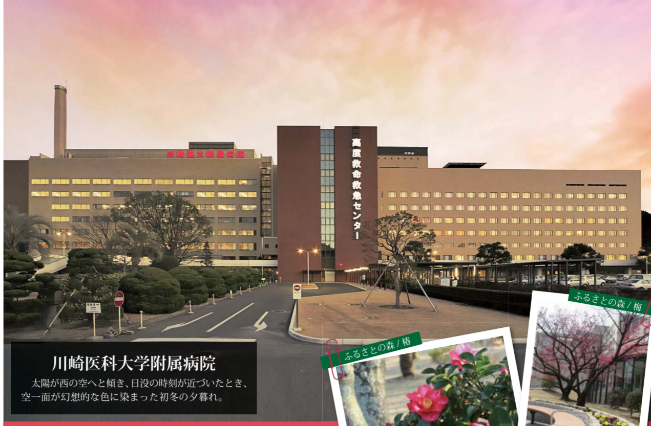
川崎医科大学附属病院

太陽が西の空へと傾き、日没の時刻が近づいたとき、空一面が幻想的な色に染まった初冬の夕暮れ。